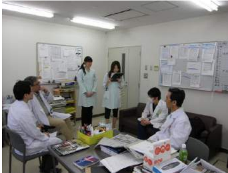
毎朝ソーシャルワーカーと情報交換

いずれの施設においても、就業時間が 40 時間/週を超える場合は、専攻医との合意の上で実施される。原則として、40 時間/週を超えるスケジュールについては自由参加とする。