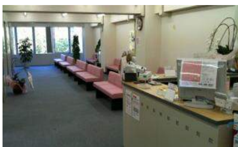
青山会関内クリニック待合室