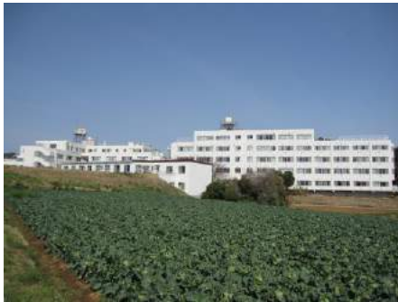
基幹施設の福井記念病院