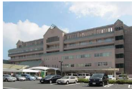
神奈川県立こども医療センター