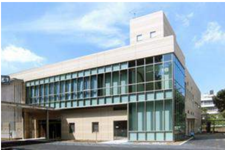
神奈川県立医療センター医療観察法病棟