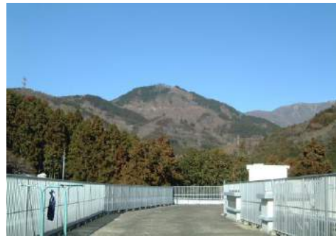
みくるべ病院から望む丹沢山麓