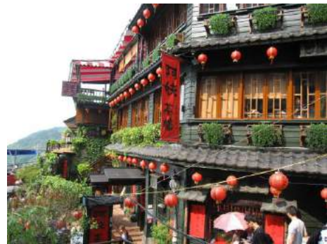
年1回職員旅行（26年9月台湾にて）