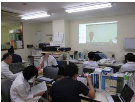
Skypeによる福井記念・みくるべ病院合同抄読会

専攻医としての研修期間は3年間ですが、4年目に専門医試験のためのレポート提出（4月末）、指定医レポート提出（6月末）、専門医試験（8月）などがあり、研修した病院にその期間も在籍していた方が良いということがあります。そのことを考慮し、1年間の延長を認めます。ただし採用時にあらかじめ契約することを条件とします。