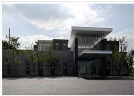
横浜カメリアホスピタル