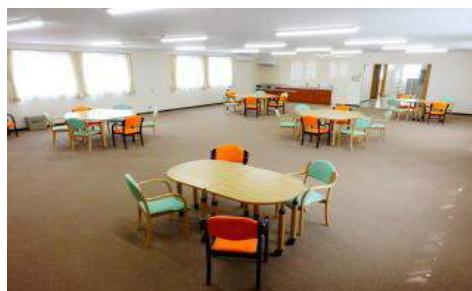
青山会津久井浜クリニックデイケア