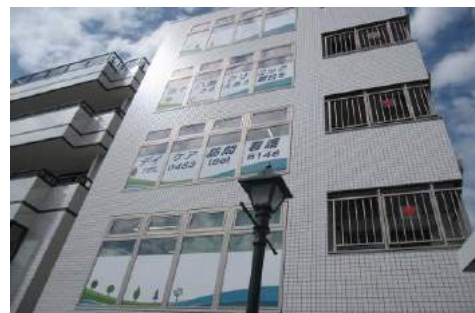
四十八瀬クリニック