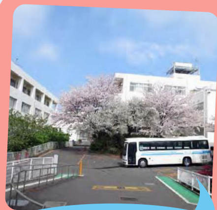
立派な桜がお出迎え