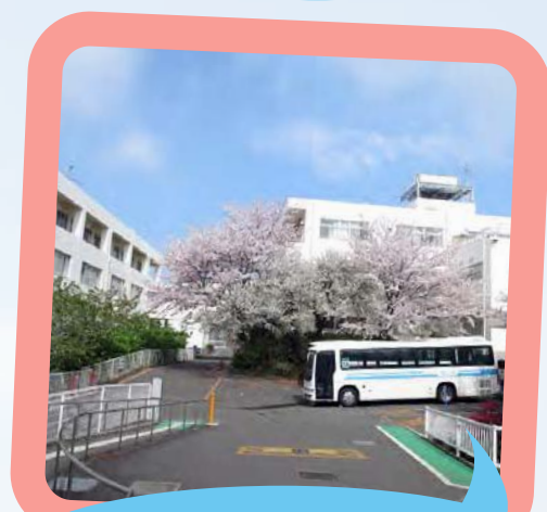
立派な桜がお出迎え