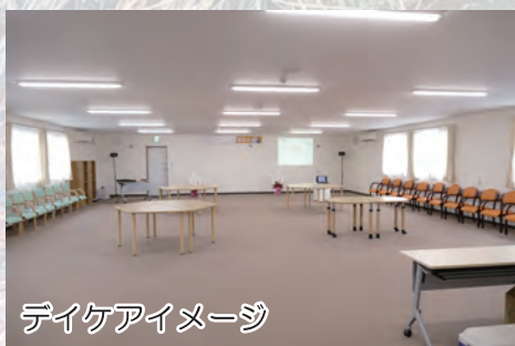
デイケアイメージ

この地域で、20年余にわたり、精神科医療に取り組んできた「みくるべ病院」は、アルコールやヤクヅツなどの「モノ」への依存を断ち切るための医療に力を注いできました。その実践の中で、依存症治療の課題として、短期間の治療だけではなく、長期的なアフターケアの必要性を痛感しました。