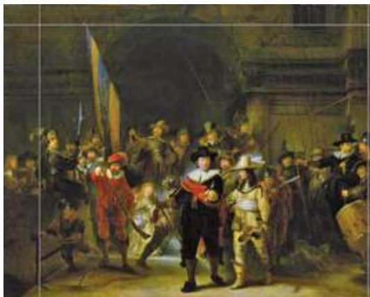
図5－レンブラント－夜警

影があるから、光が目立つ。レンブラントに光と影の効果的な使用で有名な『夜警』(図5－夜警)という絵がある。アムステルダムの国立美術館にあり、彼の代表作だ。強い日