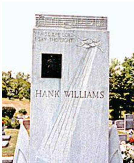
図1－ハंकウィリアムズの墓